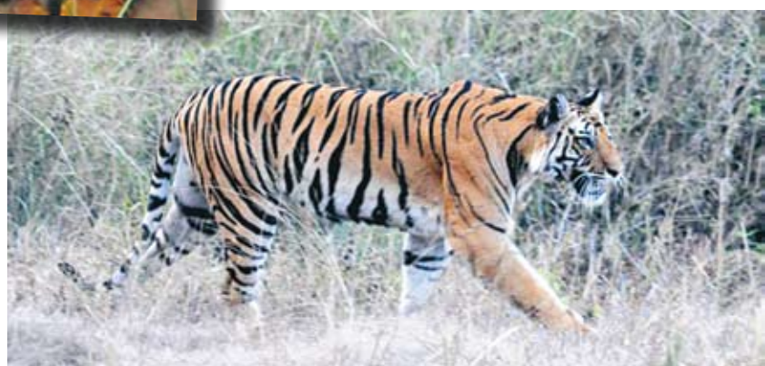
På jakt efter hjortarna